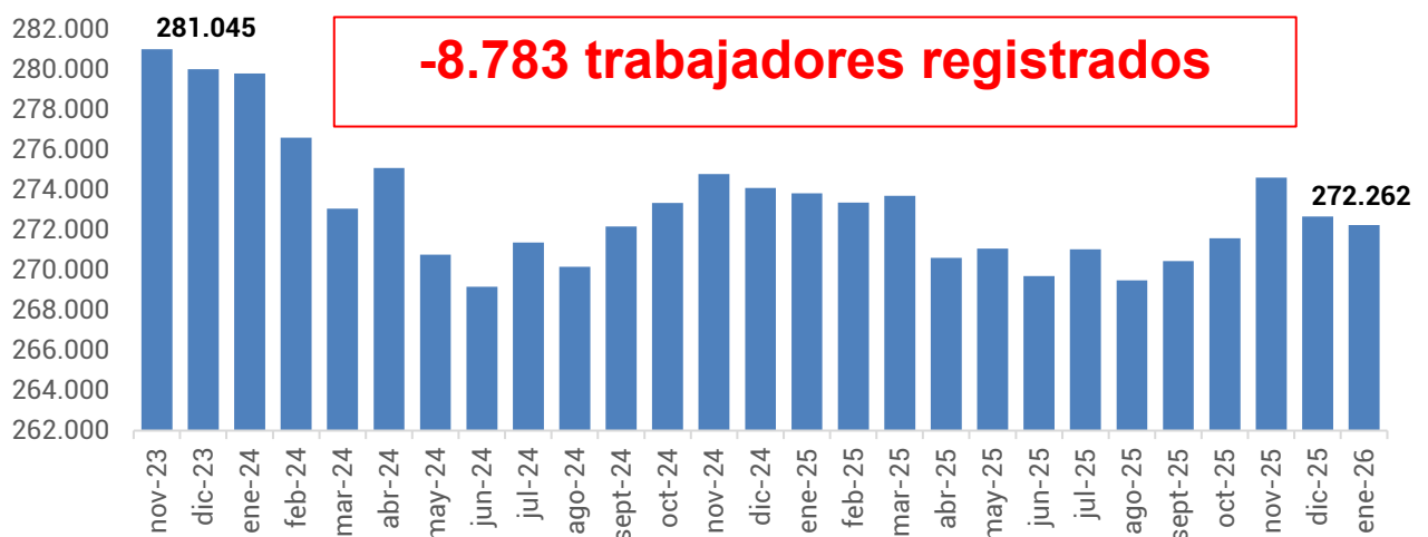
Gráfico 2. Evolución de la cantidad de trabajadores. Período: noviembre 2023 – enero 2026

Por otro lado, en el mismo período, la cantidad de trabajadores/as registrados/as se redujo 3,1%, lo que representa una pérdida de 8.783 puestos de trabajo, al pasar de 281.045 en noviembre de 2023 a 272.262 en enero de 2026.